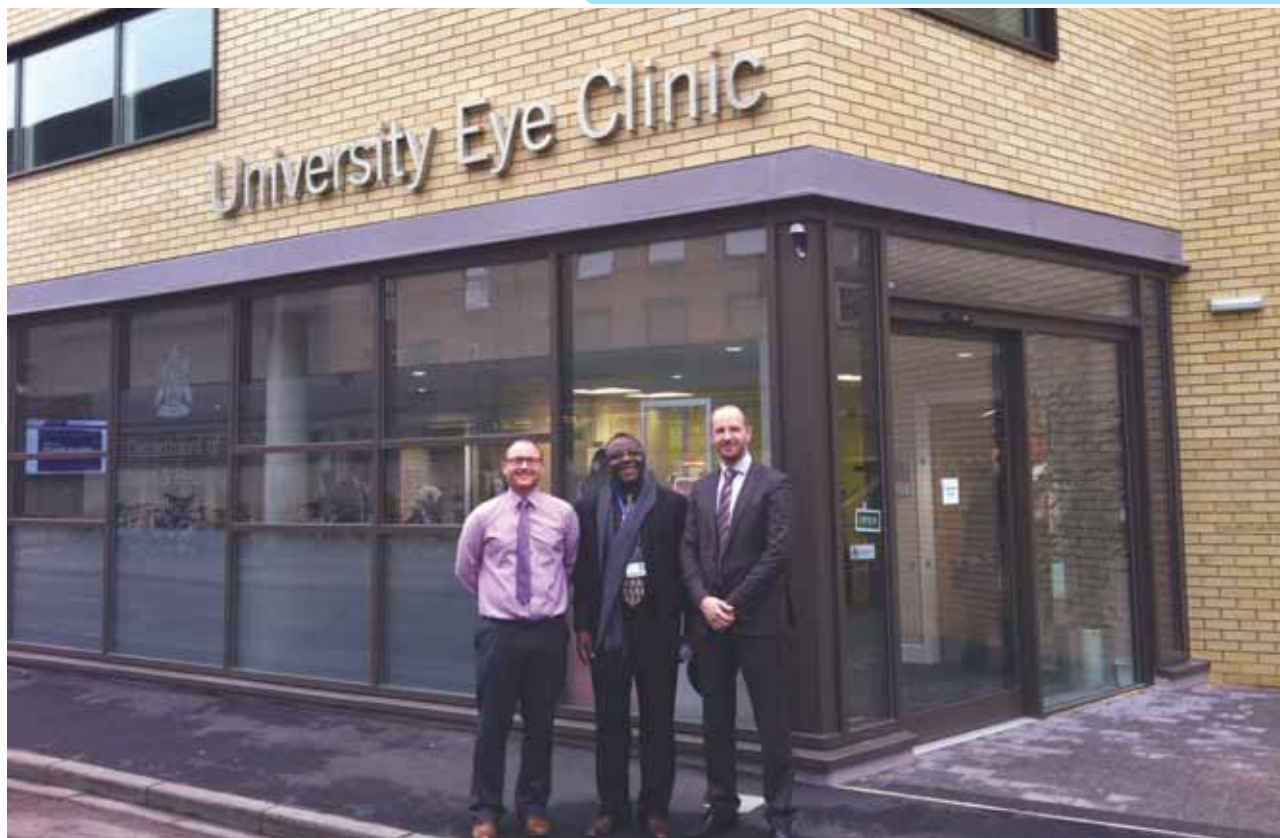
Iznimno je značajna suradnja s Anglia Ruskin University na području očne optike

nja iz centara izvrsnosti u svijetu do prihvatljive eksploatacije i primjene tih rezultata istraživanja na Veleučilištu Velika Gorica. Pojednostavljeno, potpisati bilateralni sporazum o suradnji je relativno lako ako imate dobre argumente zašto bi netko trebao uspostaviti s nama suradnju, ali održavati tu suradnju i realizirati konkretne aktivnosti kroz tu suradnju koje će donijeti dobrobiti za obje institucije iz bilateralnog sporazuma je puno teže i važnije.