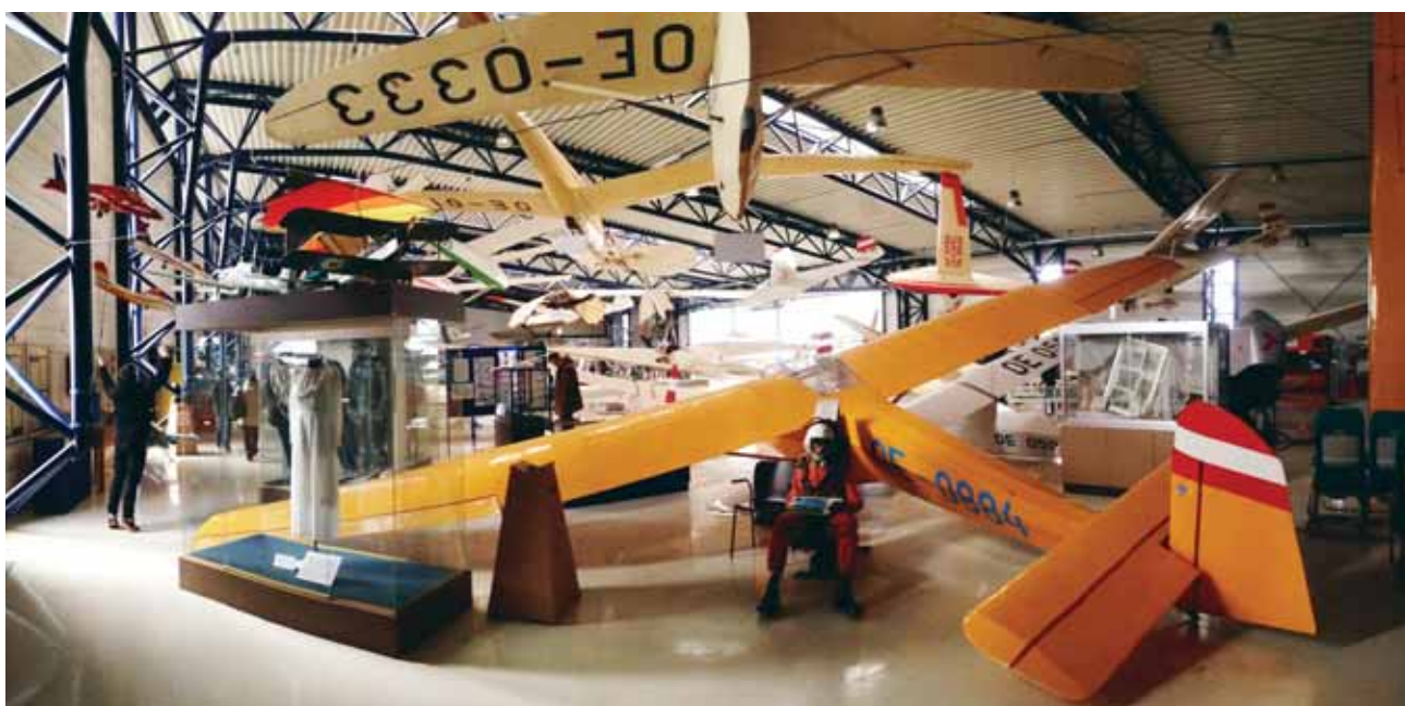
U muzeju zrakoplovstva