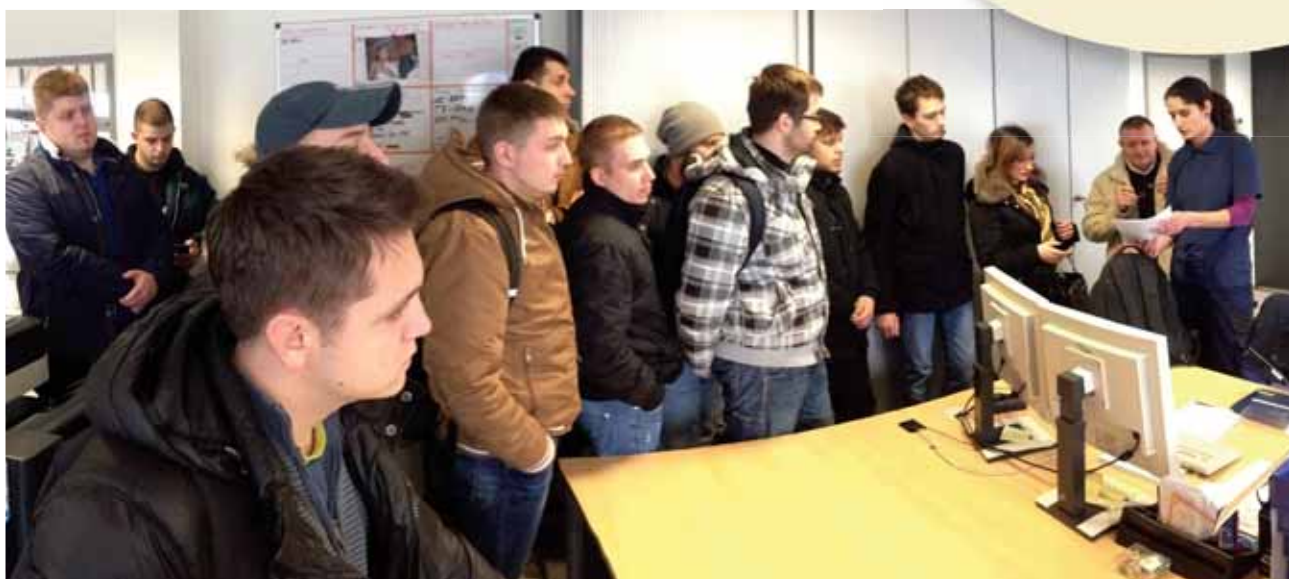
Studenti su dobili odgovore na svoja pitanja