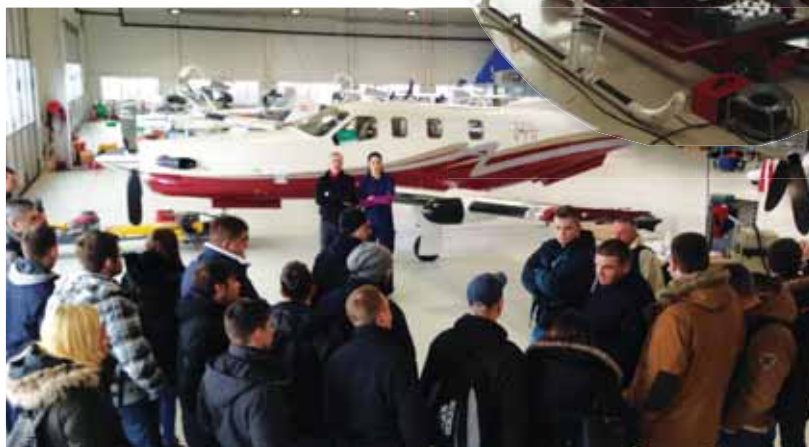
Posjet tvrtki Urbe Aero

GmbH u austrijskom gradu Wiener Neustadt.