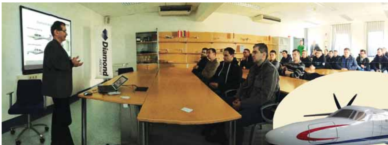
Vodeći ljudi Diamond Aircrafta pripremili su se za dolazak naših studenata