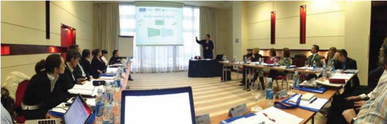
Prije početka EU projekata održan je inicijalni sastanak svih sudionika