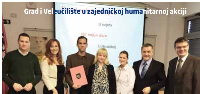
Grad i Veleučilište u zajedničkoj humanitarnoj akciji