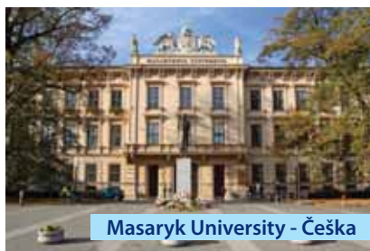
Masaryk University - Češka