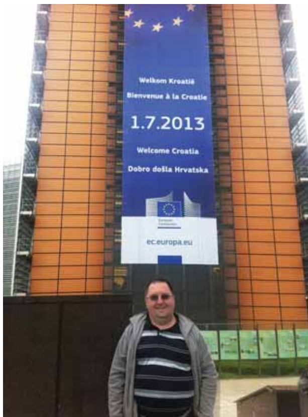
Uoči testiranja u Centru za procjenu kandidata u Bruxellesu-1

Studij ste završili kao najbolji student generacije, s prosjekom 4,9.