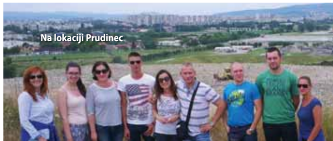
Na lokaciji Prudinec