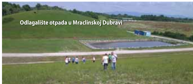
Odlagalište otpada u Mraclinskoj Dubravi