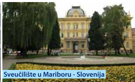
Sveučilište u Mariboru - Slovenija