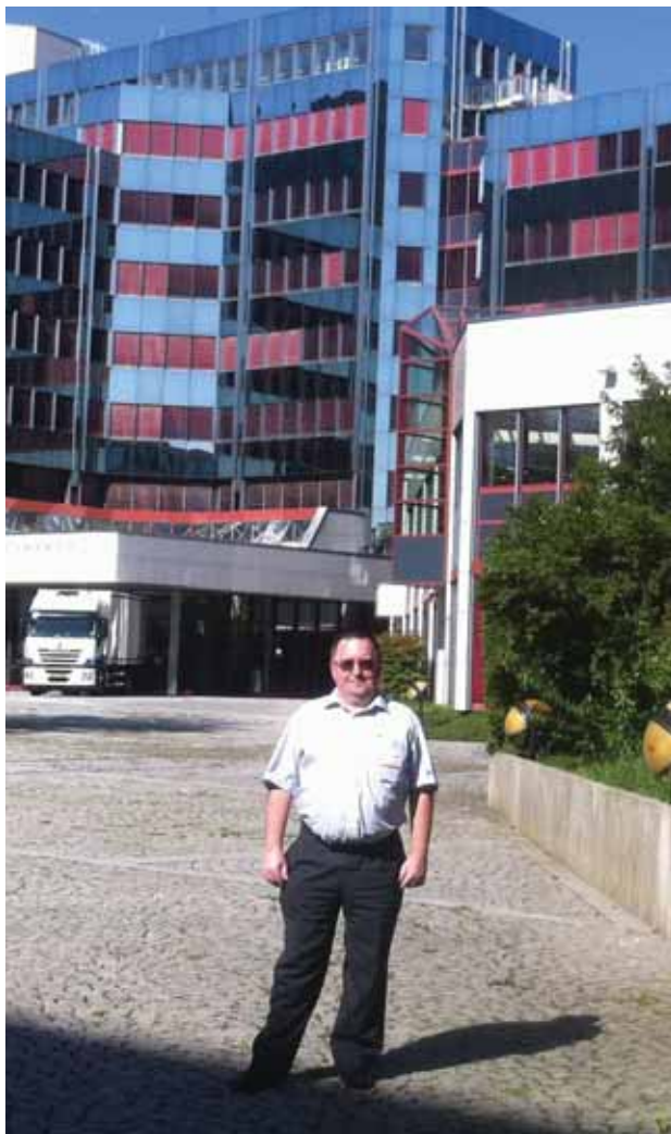
Ispred zgrade Konrada Adenauera u Luxembourg, svog budućeg radnog mjesta