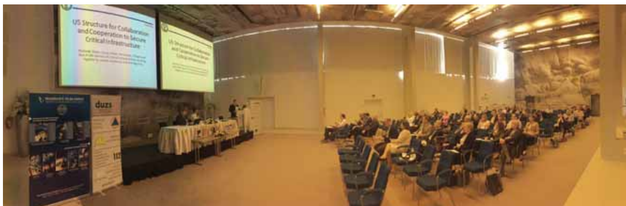
S konferencije u Splitu o EU projektima