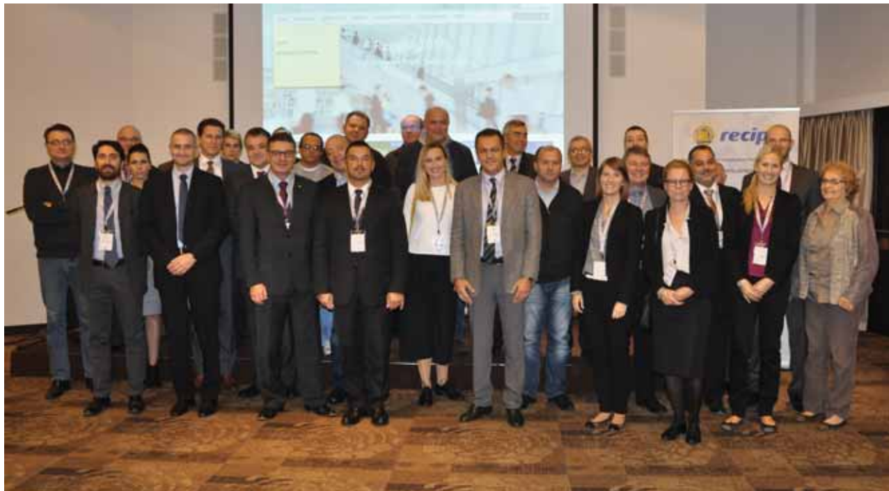
Sudionici projekta RECIPE na jednom od zajedničkih sastanaka