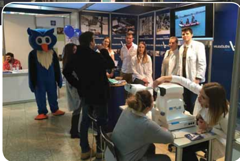
Društvo je posjetiteljima i studentima pravila i maskota Sove, zaštitni znak Veleučilišta Velika Gorica.

I ove godine Veleučilište su predstavljali studenti studija očne optike koji su posjetiteljima, naravno onima koji su to željeli, mjerili oštrinu vida. Na štandu VVG-a bili su i članovi našeg Studentskog zbora sa zadaćom da predstavljaju Veleučilište i dijele promotivne materijale.