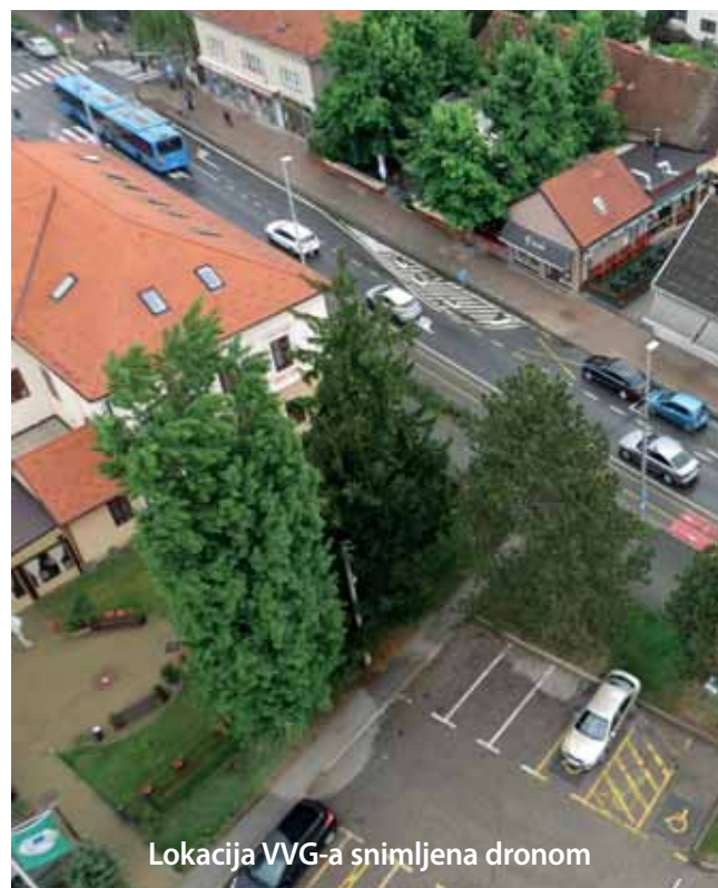
Lokacija VVG-a snimljena dronom