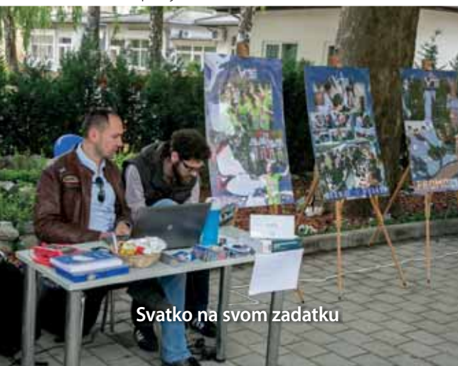
Svatko na svom zadatku

Dan otvorenih vrata ujedno je bila i prilika i da studenti nabave knjige u izdanju VVG-a kao i majice s logom Veleučilišta po posebnim cijenama.