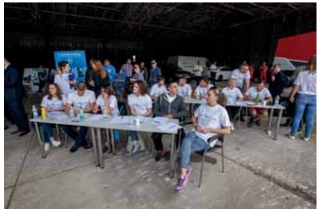
Dolazak gostiju i priprema prije početka pokazne vježbe