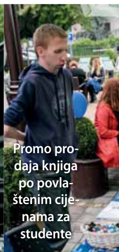
Promo prodaja knjiga po povlaštenim cijenama za studente