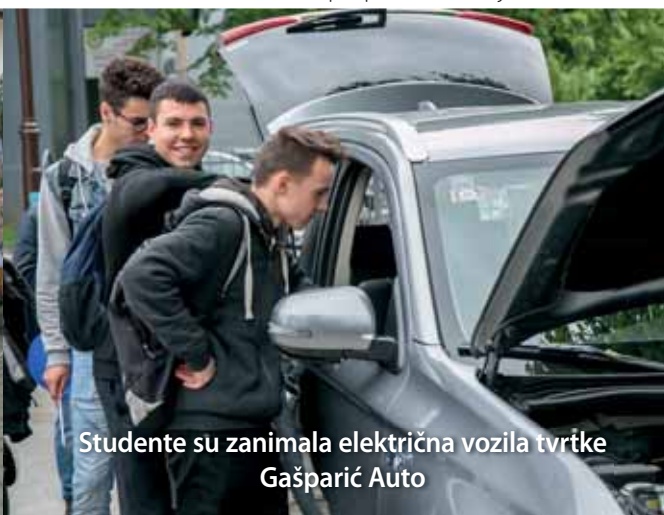
Studente su zanimala električna vozila tvrtke Gašparić Auto