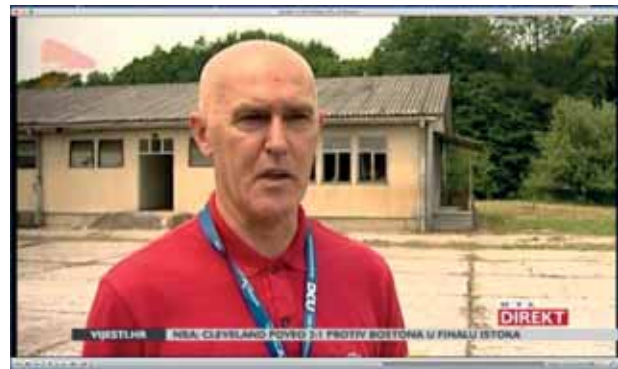
U BIVŠOJ VOJARNI U STUBIČKOJ SLATINI ODRŽANE DVJE POKAZNE VJEŽBE S ATRAKTIVNIM SCENARIJIMA: