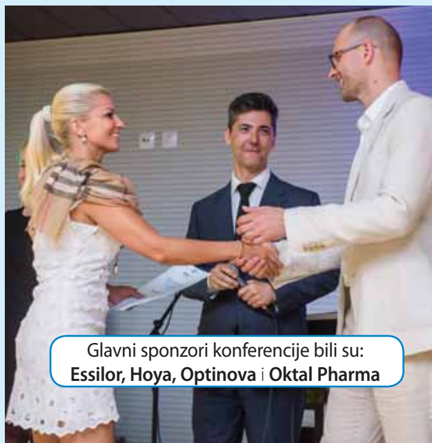
Glavni sponzori konferencije bili su: Essilor, Hoya, Optinova i Oktal Pharma