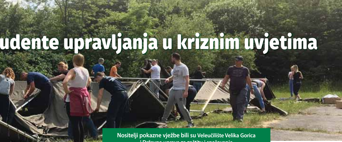
Nositelji pokazne vježbe bili su Veleučilište Velika Gorica i Državna uprava za zaštitu i spašavanje