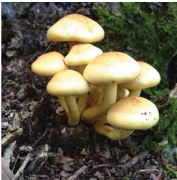
Sumporača ( Hypholoma fasciculare ), otrovna je gljiva koja izaziva probavne smetnje

Iako su vrganji slabo krenuli, šuma nas je podarila sunčanicama, lisičarkama, krasnicama, puharama i mrkim trubačima. Na livadama pak se nađu livadni šampinjoni i goleme puhare.