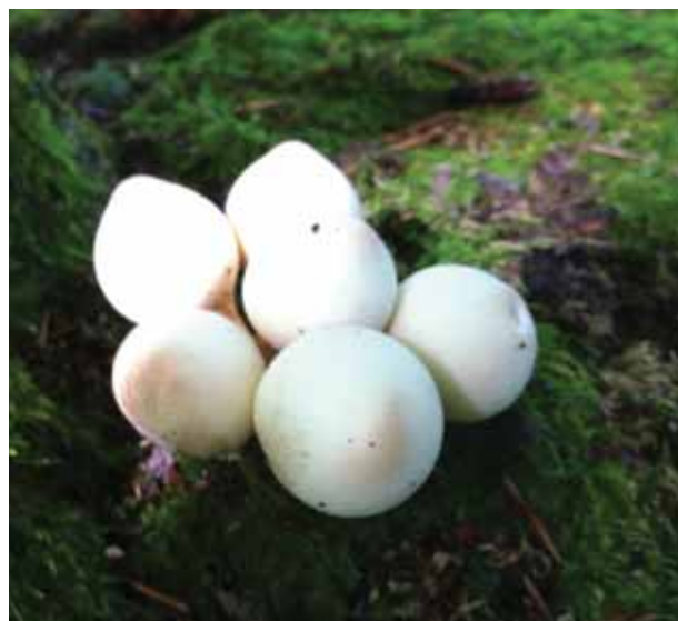
Tikvasta puhara ( Lycoperdon perlatum ) vrsta je jestive gljive