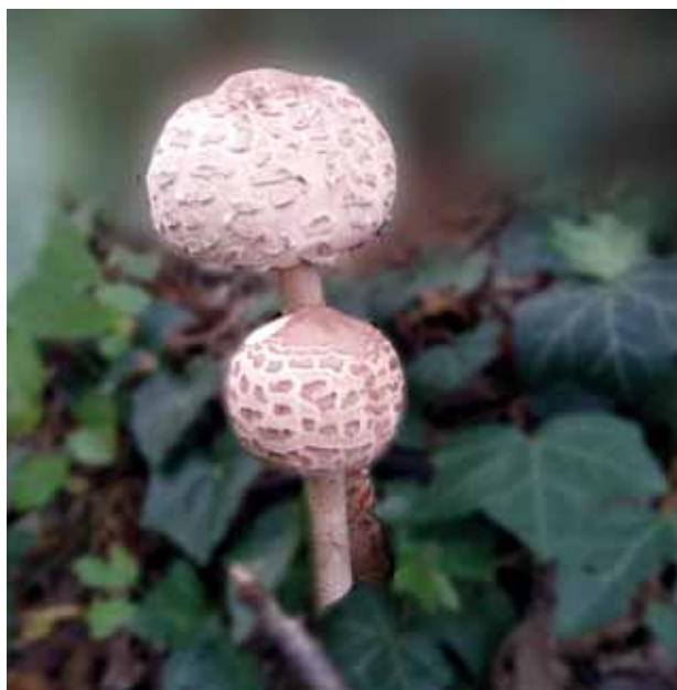
Velika sunčanica ( Macrolepiota procera ) poznata je jestiva gljiva iz obitelji Agaricaceae, cijenjena i izvrsne kakvoće. Jedna je od većih gljiva, podsjeća na damski suncobran.

Tu su i sumporače, zavodnice, muhare prekrasnih boja, ali pune opasnih toksina.