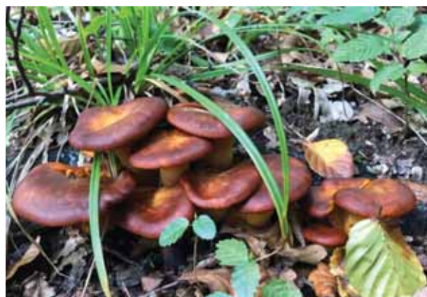
Gljiva zavodnica - otrovna gljiva koja svijetli u mraku

S obzirom na očišćenje šuma, intenzivnu sječu i klimatske promjene gljiva je, nažalost, sve manje. Neke od njih su već i zaštićene popu blagve, kraljevke, maglena, stoga, pravi