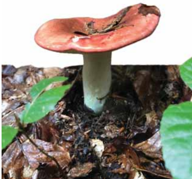
Bljuvara ili paprena krasnica ( Russula emetica ) otrovna je gljiva iz roda Russula , odjeljka stapčara.

Tu su i sumporače, zavodnice, muhare prekrasnih boja, ali pune opasnih toksina.