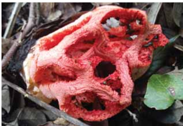
Vještičino srce ( Clathrus ruber ) je vrsta saprofitne gljive porodice Phallaceae. Nejestiva je zbog izuzetno neugodnog smrada sličnom trulom mesu.