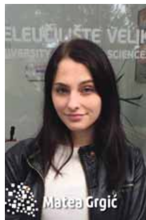
2. godina, Upravljanje u kriznim uvjetima

te im ovim putem još jednom zahvaljujemo