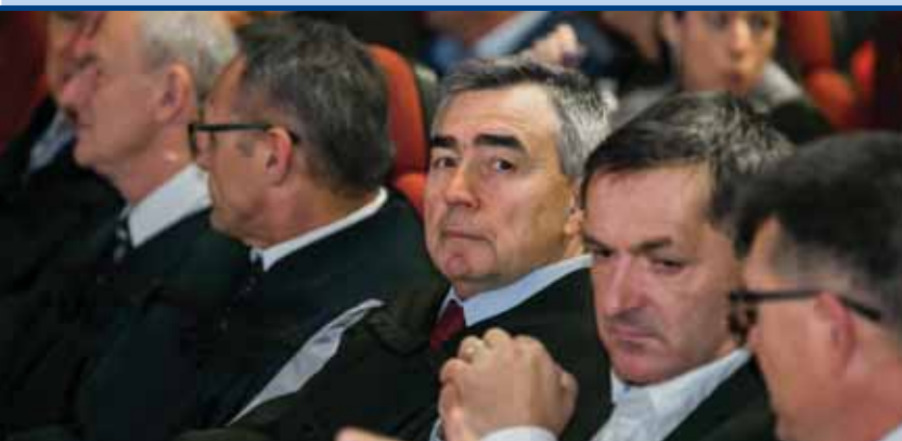
Diplomante je pozdravio i čestitao na njihovim diplomama i gradonačelnik Velike Gorice Dražen Barišić