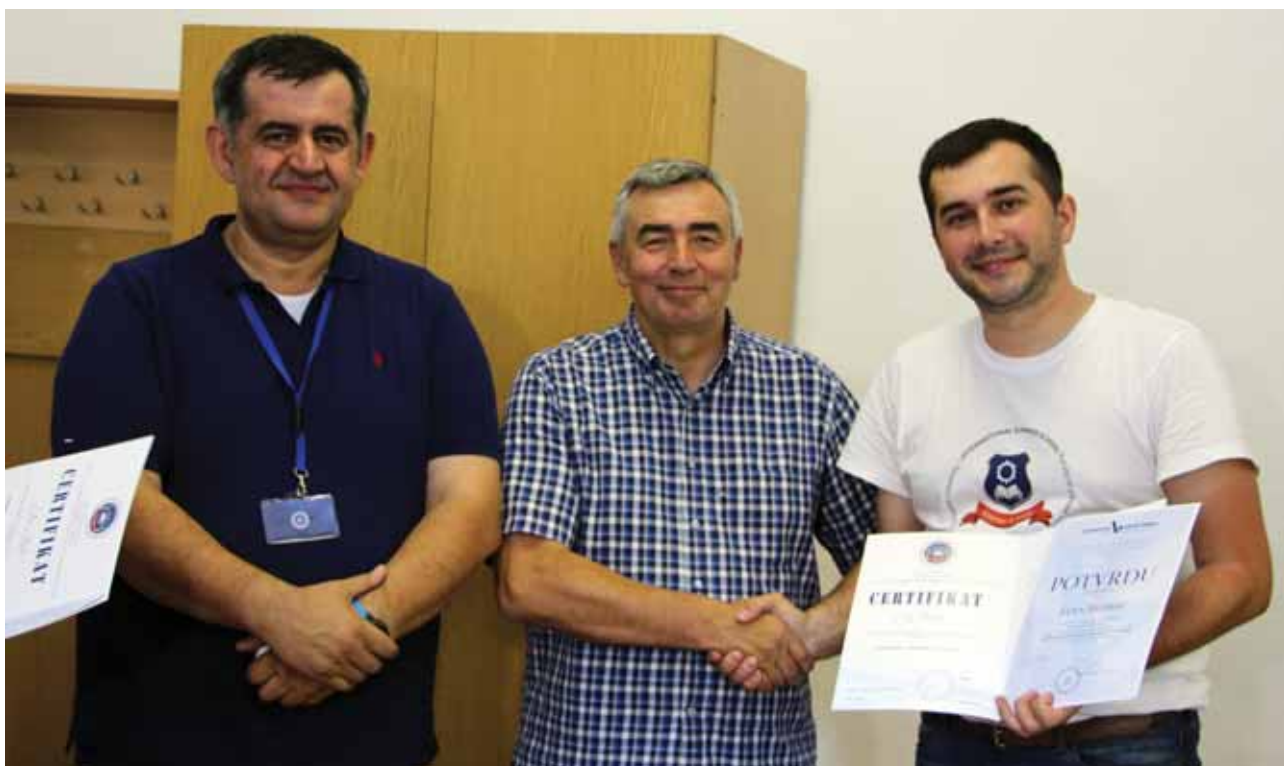
Polaznicima Međunarodne ljetne škole dodijeljena su dva certifikata – Fakulteta za kriminalistiku, kriminologiju i sigurnosne studije Univerziteta u Sarajevu i Veleučilišta Velika Gorica.