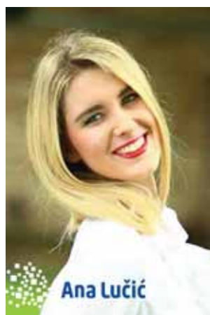
1. godina, Očna optika

Moja prijateljica studira na Veleučilištu pa sam se i sama na VVG došla raspitati o studiju očne optike. Kao prednost studiranja stručnog smjera istaknula bih kvalifikacije određenog područja discipline kojom ću se u budućnosti baviti i koje me zanima. Od Veleučilišta očekujem susretljivost i pomoć u prvim danima studija, a u novoj akademskoj godini očekujem nova poznanstva. Spremna sam prihvatiti sve izazove koji će se pojaviti na prvoj godini stručnog studija.