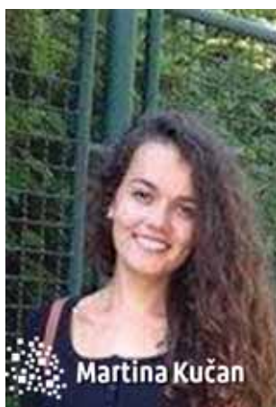
1. godina, Očna optika

Očekujem da ću se kroz praktični dio nastave kvalitetno pripremiti za buduće zvanje optometristice te da ću, također, usvojiti neke optičarske vještine. Za Veleučilište sam doznala preko starijih studentica koje su zadovoljne radom VVG-a te zanimanjem koje ću steći nakon završetka studija. Što se tiče nove akademske godine, očekujem nova poznanstva te nove