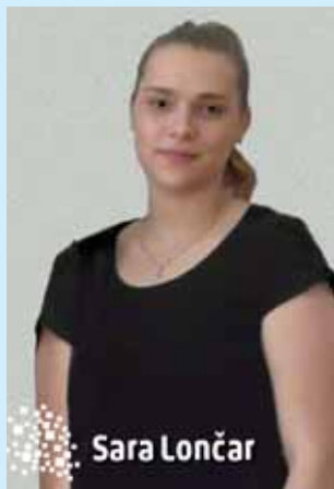
predsjednica Studentskog zbora VVG-a