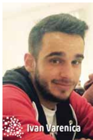
3. godina, Održavanje računalnih sustava

završili upravo ovaj smjer. Mislim da ću na stručnom studiju održavanja računalnih sustava, zbog plana i programa rada, dobiti više znanja nego što bih dobio na nekom drugom preddiplomskom studiju. Još jedna prednost koju ističem je priprema za rad koju dobivam završetkom Veleučilišta te brzi pronalazak zaposlenja. Od nove akademske godine očekujem usavršavanje informatičkih vještina i znanja, kao i upoznavanje s novim tehnologijama i metodama rješavanja problema. Najviše se veselim nastavku studiranja u informatičkim područjima i usavršavanju struke kako bih mogao biti što kompetentniji za rad.